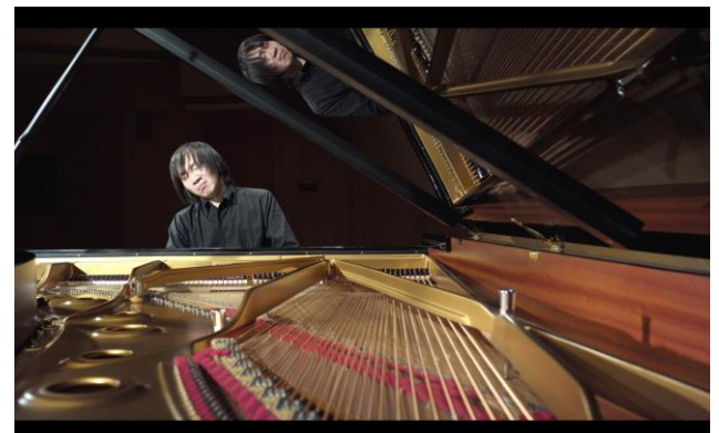
近距離での広角撮影