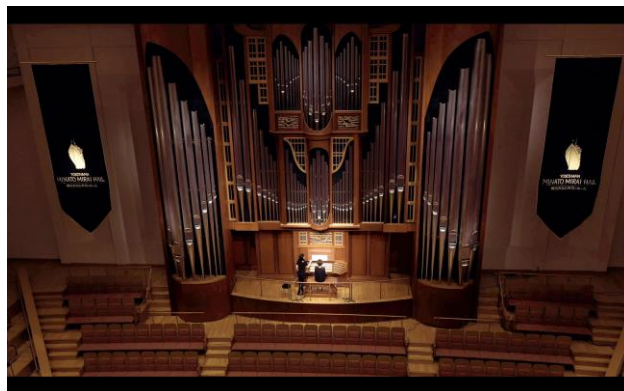
ホール内上空からの空撮