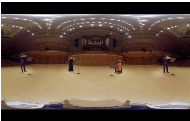
ホールステージ上で円になって収録