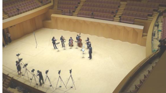
自由視点の撮影風景。