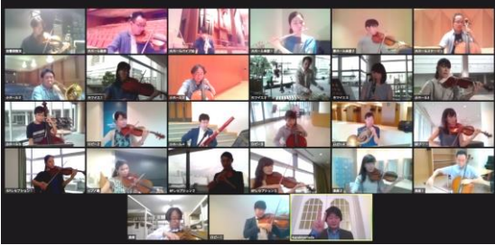
オンラインツール Zoom を使用したリモート収録風景

ドローンや高解像度（8K）カメラ、360度カメラ、小型広角カメラを使用した撮影の他、ベルリンと日本の奏者を繋いでの同時リモート収録や、16台ものカメラを用いた自由視点撮影（*1）も敢行。新制作作品は延べ120以上にのぼります。